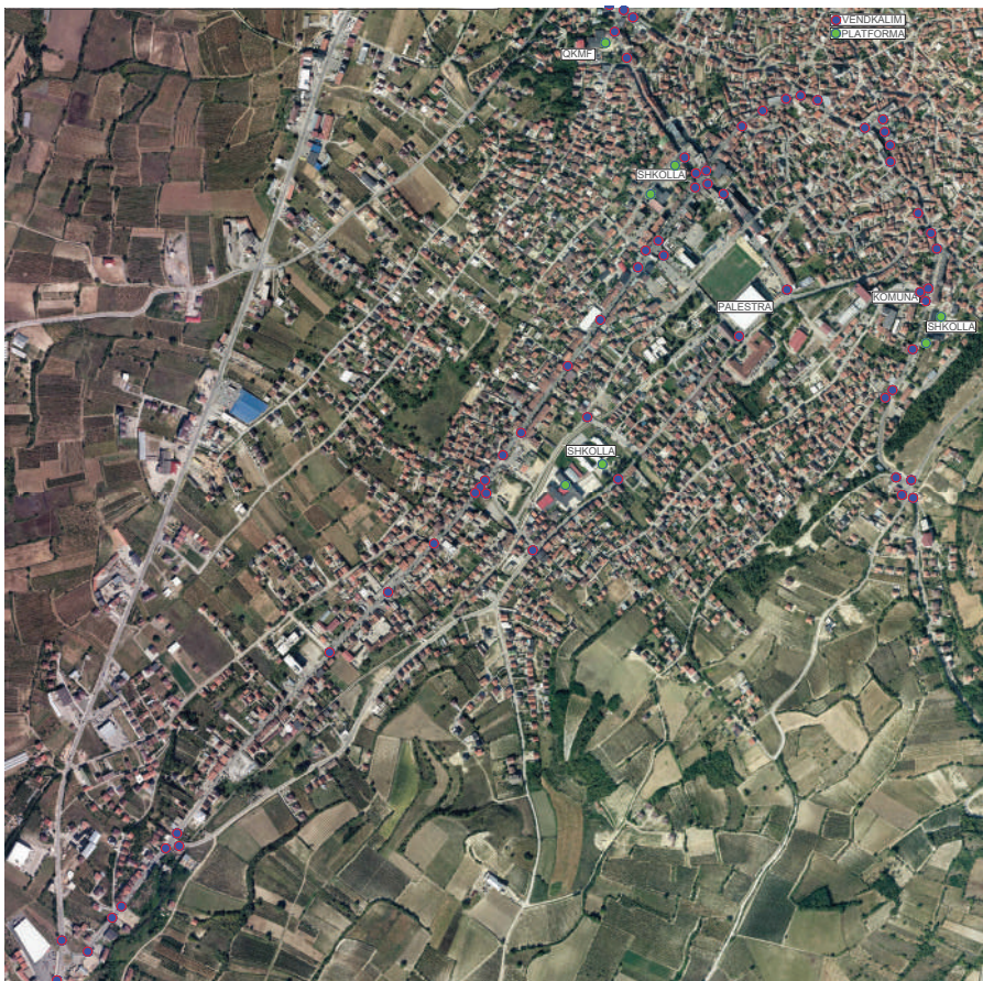
Slika 1. Mapa sa infrastrukturnim investicijama za pristup osobama sa posebnim potrebama u gradu Orahovcu.